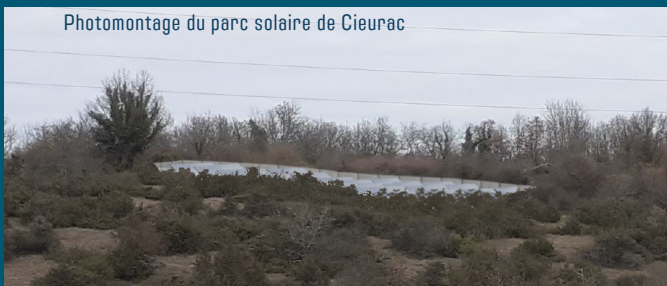
Photomontage du parc solaire de Cieurac

Sur les communes de Cieurac, Bellefont La Rauze et d'autres encore !